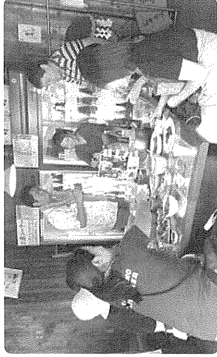
各蔵やワイナリーでの試飲やおもてなしを楽しんだ参加者たち (写真は廣田酒造店)

「ワインツアーリズムいわて2019」が8月31日と9月1日、町と花巻市で開催されました。県内外から約200人が参加。町内の酒蔵とワイナリーは8月31日のみの参加でしたが、専用バスが各地を巡回し、参加者は時間いっぱい各蔵やワイナリーでの試飲やイベントを満喫していました。県外からの参加者は「日本酒やワインはもちろん、町の豊かな自然も楽しんでいきます」と満足の笑顔でした。