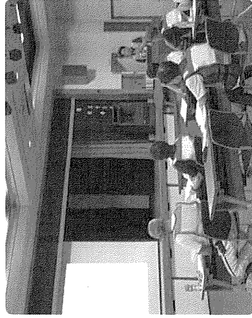
講習会初日は、町の高齢化率などの現状を学びました

この体操は、各地域の元氣な高齢者自身が指導者となって活動していくことが特徴。町内で体操の指導・普及を行う「いきいき健康推進隊」のメンバー5人が1級指導者の資格を取得したことから、今回の講座で初めて講師を務めました。参加者は、骨や筋肉、神経などの名称・働きのほか、日常生活動作に必要な筋力をつけたり、関節の動きを良くしたりするための体操を学びました。